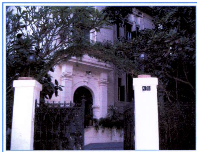
Slika 2: Danes na Rue el Haras 9 v Kairu

Slovenski zavod domuje v sijajni čisto beli palači na lepi široki polkrožni ulici. Srce mi močno bije, ko se mu približujemo z južne strani. Podoba iz stare Lidijine razglednice v meni še vedno živi in takoj ga prepoznam, čeprav se sramežljivo skriva v zavetju visokih palm in drugih eksotičnih dreves in grmov. Stavbo krasí brezhíбно vzdrževana kamnita fasada, razkošno zasajen in lepo vzdrževan park, ki izdaja njen nekdanji sijaj in razkošje. Ni več na samem, kot na stari razglednici iz leta 1949. Zdaj je to tiha ulica strjeno grajenih visokih palač in star dvorec se počuti zelo utesnjen v tej soseski, ki je še vedno ugledna. Nekdanjega luksuza in čistoče žal ni več zaznati, iz stranskih ulic se plazi zanikrnost in vendar je tu veliko lepše kot v drugih mestnih četrtih.